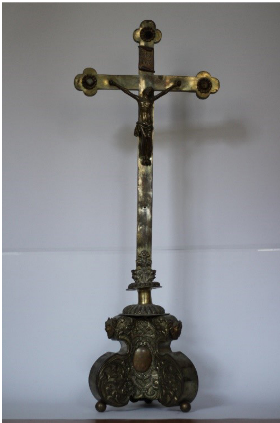
Obr. 26 Kríž kardinála-kniežaťa Kristiána Augusta pred obnovou povrchu, okolo roku 1700 (?), Kláštor Kongregácie bratov tešiteľov z Gethseman v Marianke.