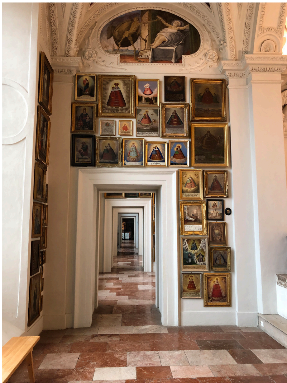
Obr. 12 Pohľad na emporu pútného kostola v Mariazelli s veľkým počtom votívnych obrazov vystavených mozaikovitým spôsobom. Múzeum mariazellskej pokladnice. Foto: 06/2022.