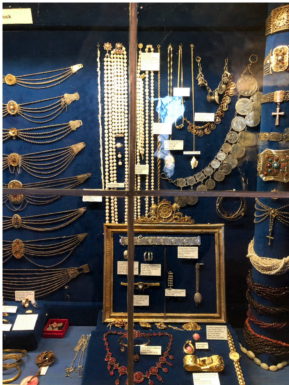
Obr. 3 Rôznorodé šperky uložené vo vstavanej vitríne pokladnice pútnického kostola v Kismáriazelli (Cellödömölkü). Foto: 04/2022.