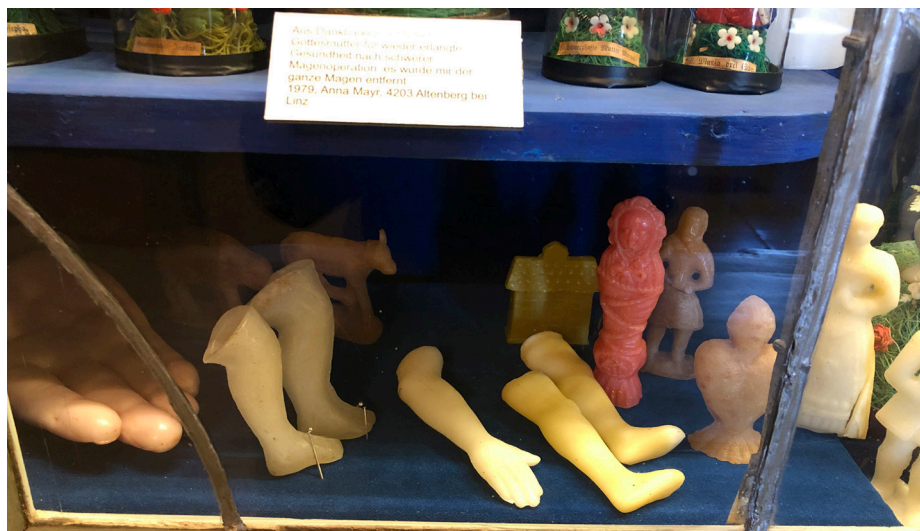
Obr. 6 Antropomorfné obetiny z vosku v pokladnici pútnického kostola v Kismáriazellí (Celldömölku). Foto: 04/2022.