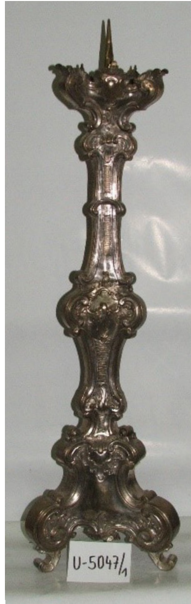
Obr. 24, 25 Dvojica svietnikov z Marianky v zbierkach Múzea mesta Bratislavy, druhá tretina 18. storočia (?). Zdroj: Archív Múzea mesta Bratislavy, identifikačné číslo U-5047/1 a U-5047/2