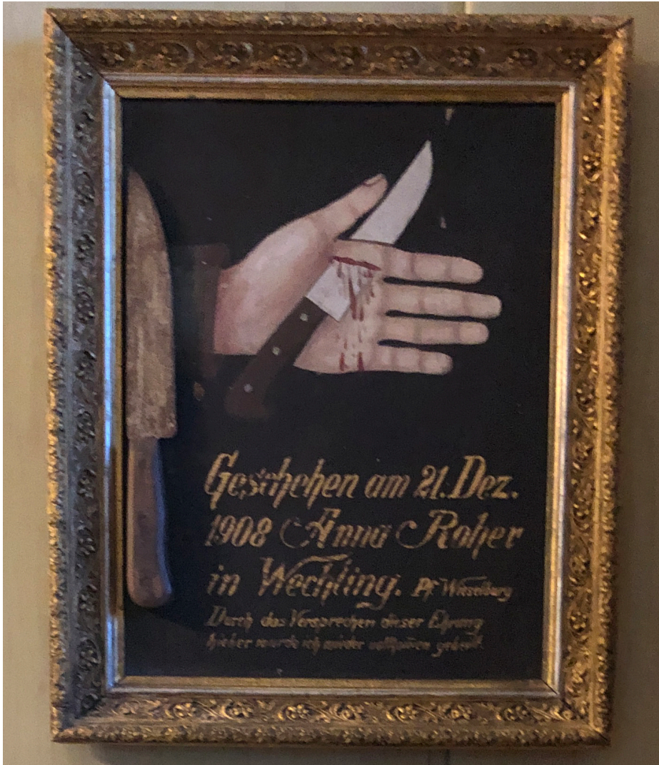
Obr. 9 Votívny obraz so zobrazením poranenia ruky. Súčasťou obrazu je aj originál noža, Múzeum mariazellskej pokladnice. Foto: 06/2022.