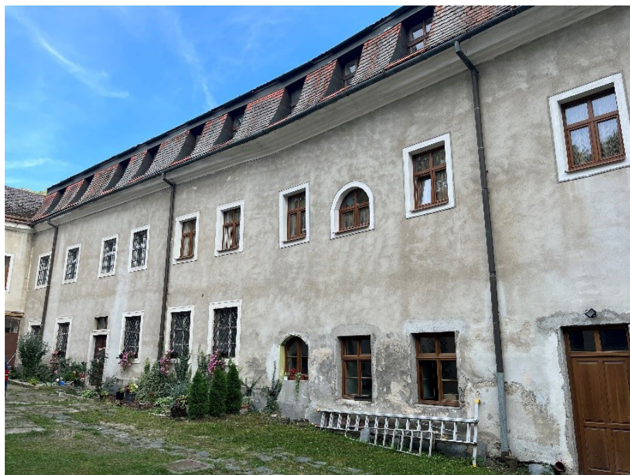
Obr. 17 Pohľad na jedno z krídel kláštora tešiteľov priliehajúce k severnej stene pútneho kostola v Marianke. Na druhom nadzemnom podlaží sa pravdepodobne nachádzala pútnická pokladnica (v rovnakých priestoroch bolo v roku 1940 zriadené tzv. prikostolné múzeum). Foto: 09/2022.