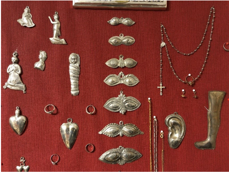
Obr. 27 Detail nástennej podložky so zachovanými antropomorfnými votívnymi darmi z kovu, 18./19. storočie (?), Kláštor Kongregácie bratov tešiteľov z Gethseman v Marianke. Foto: 04/2022.