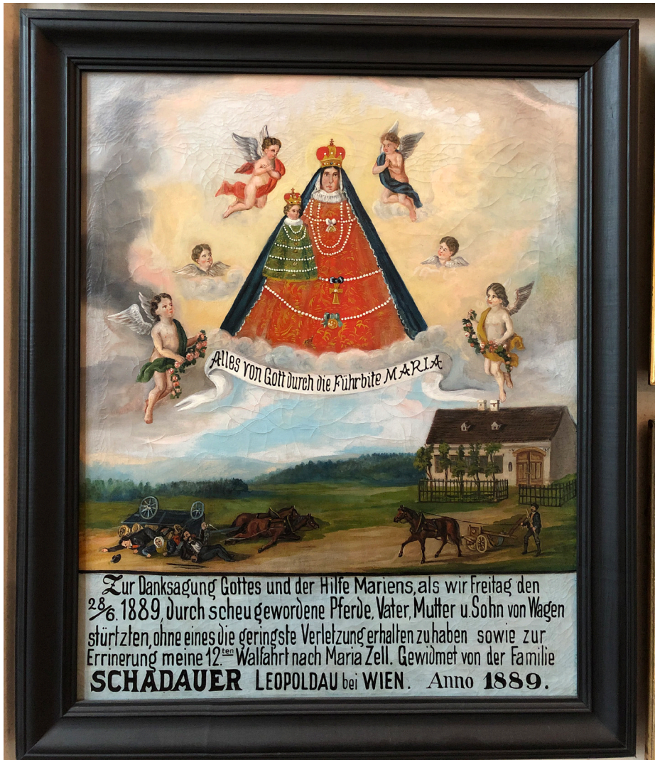
Obr. 4 Charakteristický príklad ďakovného votívneho obrazu, venovaného po nešťastnej udalosti.

Nápis v spodnej časti ozrejmjuje dôležité údaje o nehode konského povozu.