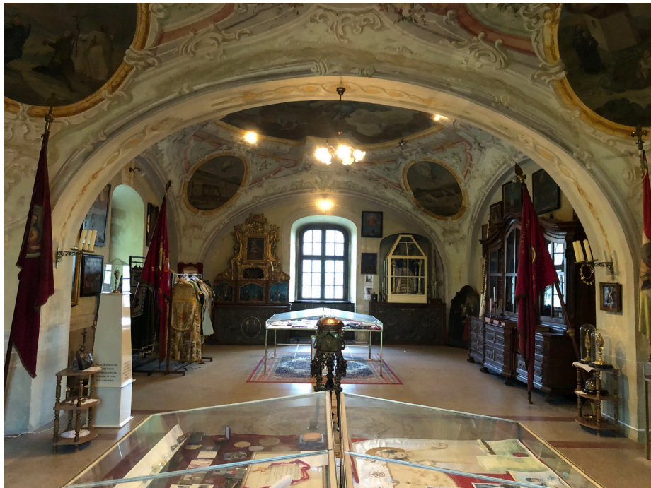
Obr. 15 Pohľad do priestoru pútnickej pokladnice v Kismáriezelli (Celldömölk). Foto: 04/2022.