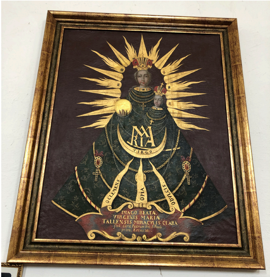
Obr. 16 Obraz spodobujúci Madonu z Marianky vo farskom Kostole Svätého Jakuba v maďarskej obci Árpás, okolo polovice 18. storočia (?). Foto: 04/2022.