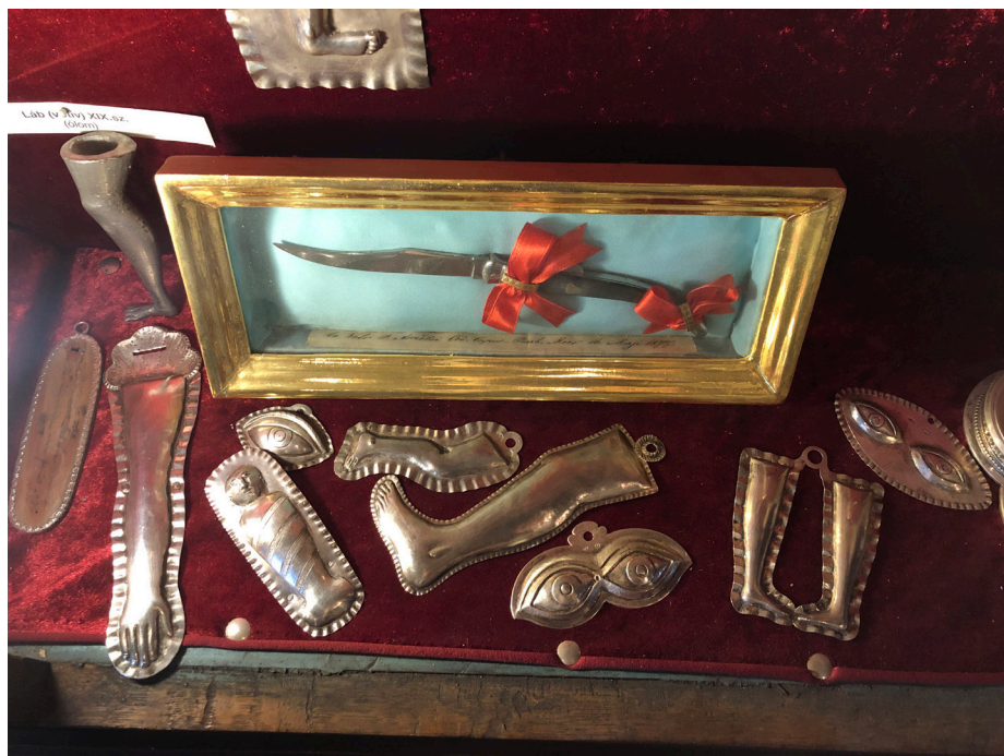
Obr. 5 Antropomorfné obetiny vyhotovené z tepaného kovu v pokladnici pútnického kostola v Kismáriazellí (Celldömölku). Foto: 04/2022.