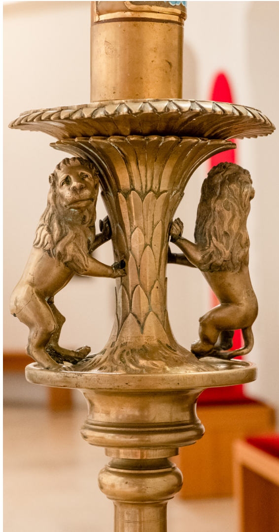
Obr. 21, 22 Veľkonočný svietnik so znakom rádu pavlínov v pútnickom kostole v Marianke, druhá polovica 17. storočia. Foto: 08/2023.