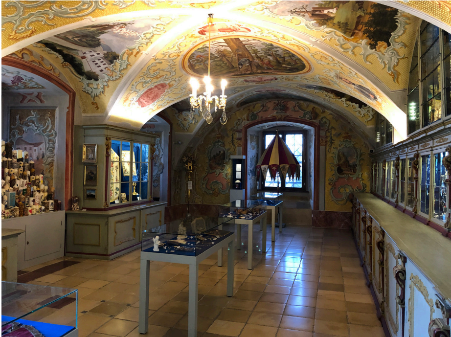
Obr. 1 Pohľad do pokladnice pri pútnom kostole v Maria Taferl. Foto: 04/2022.