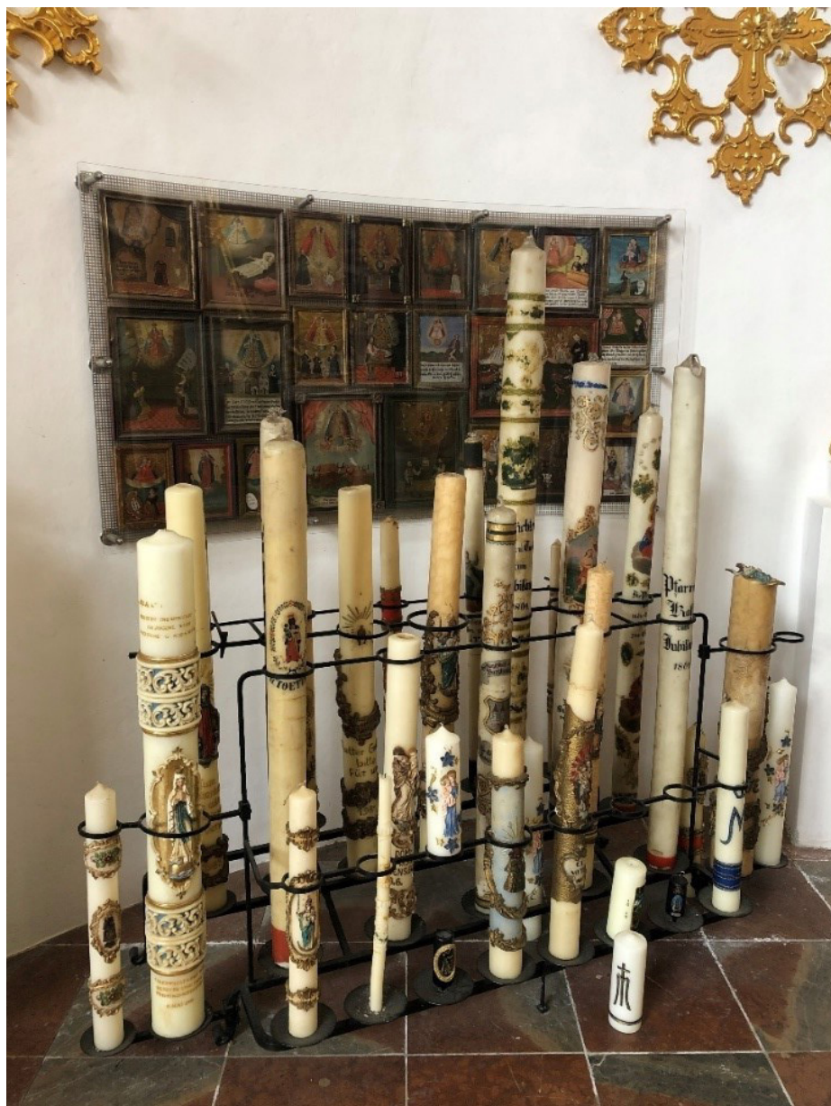
Obr. 8 Časť kolekcie historických pútných sviec a paškálov uchovávaných v Kostole Panny Márie na Marienbergu pri Burghausene. Foto: 04/2022.