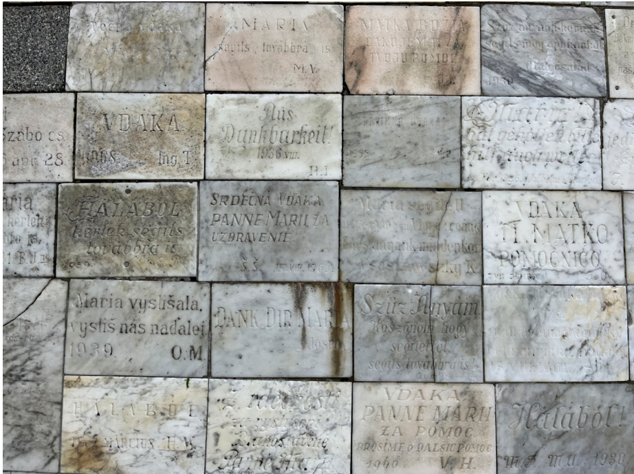
Obr. 13 Ďakovné tabuľky osadené pri Lurskej jaskyni na Kalvárii v Bratislave. Foto: 05/2023.