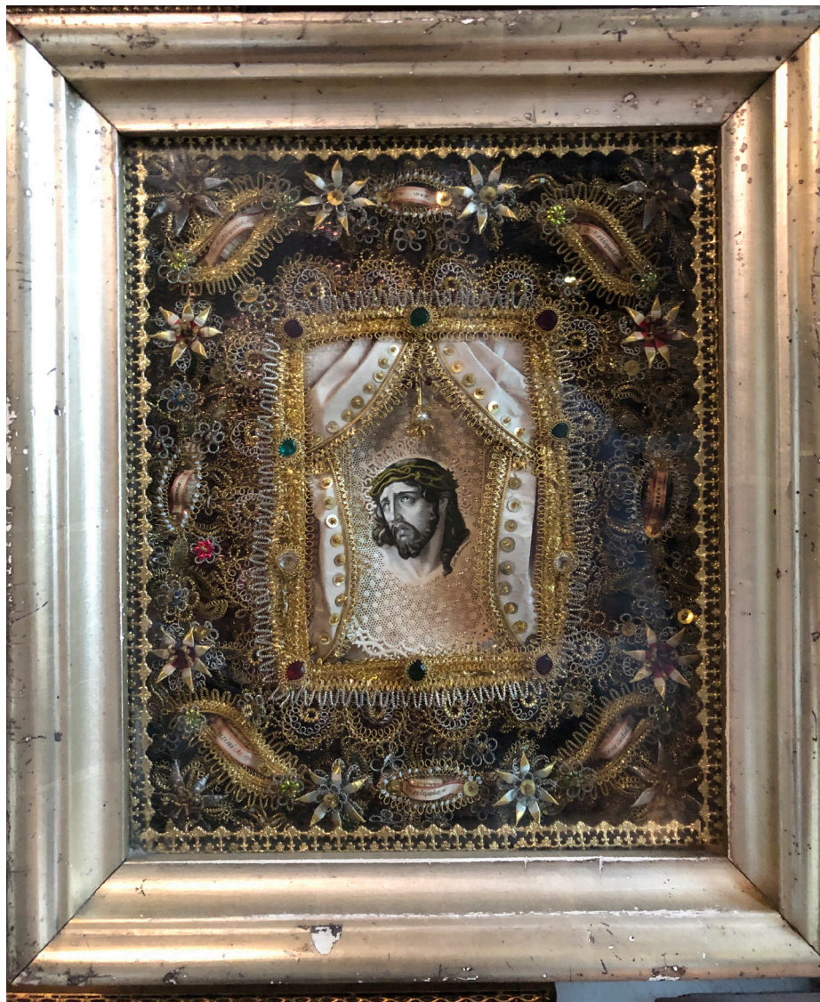
Obr. 10 Votívny obraz s aranžmánom okolo podoby Bolesného Krista (zv. kláštorňa práca) Múzeum mariazellskej pokladnice. Foto: 06/2022.