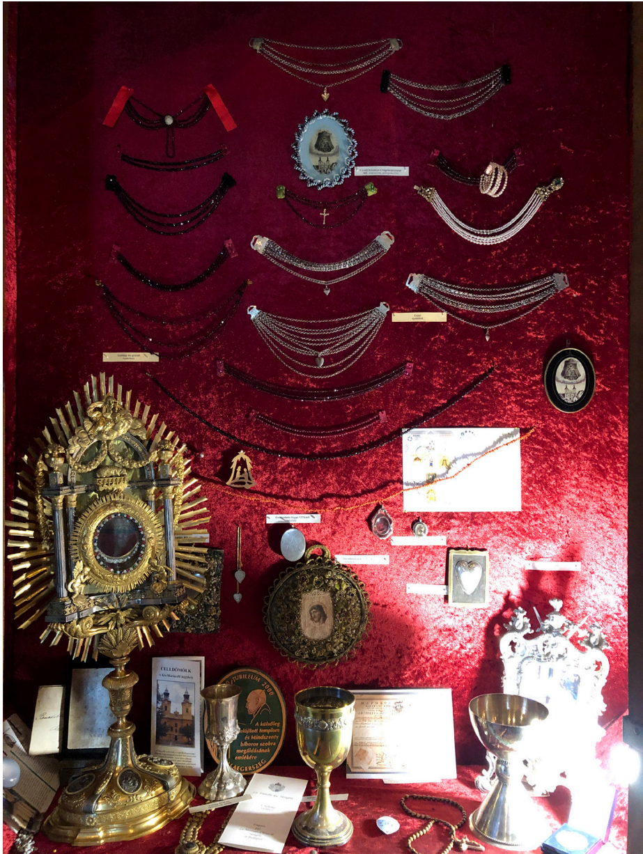
Obr. 2 Liturgické nádoby uložené v uzamknutej vitríne pokladnice pútnického kostola v Kismáriazelli (Celdömölku). Foto: 04/2022.