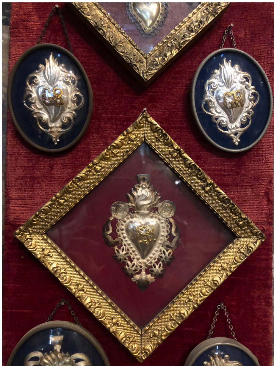
Obr. 7 Obetiny v podobe srdca vystavené pri bočnom oltári v Kostole Svätého Rochusa v Turine.