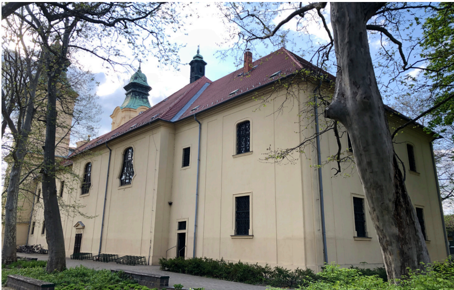
Obr. 14 Juhovýchodná fasáda Baziliky Narodenia Panny Márie v Kismáriazelli (Celldömölk). Pokladnica sa nachádza na druhom nadzemnom podlaží za ukončením presbytéria. Foto: 04/2022.