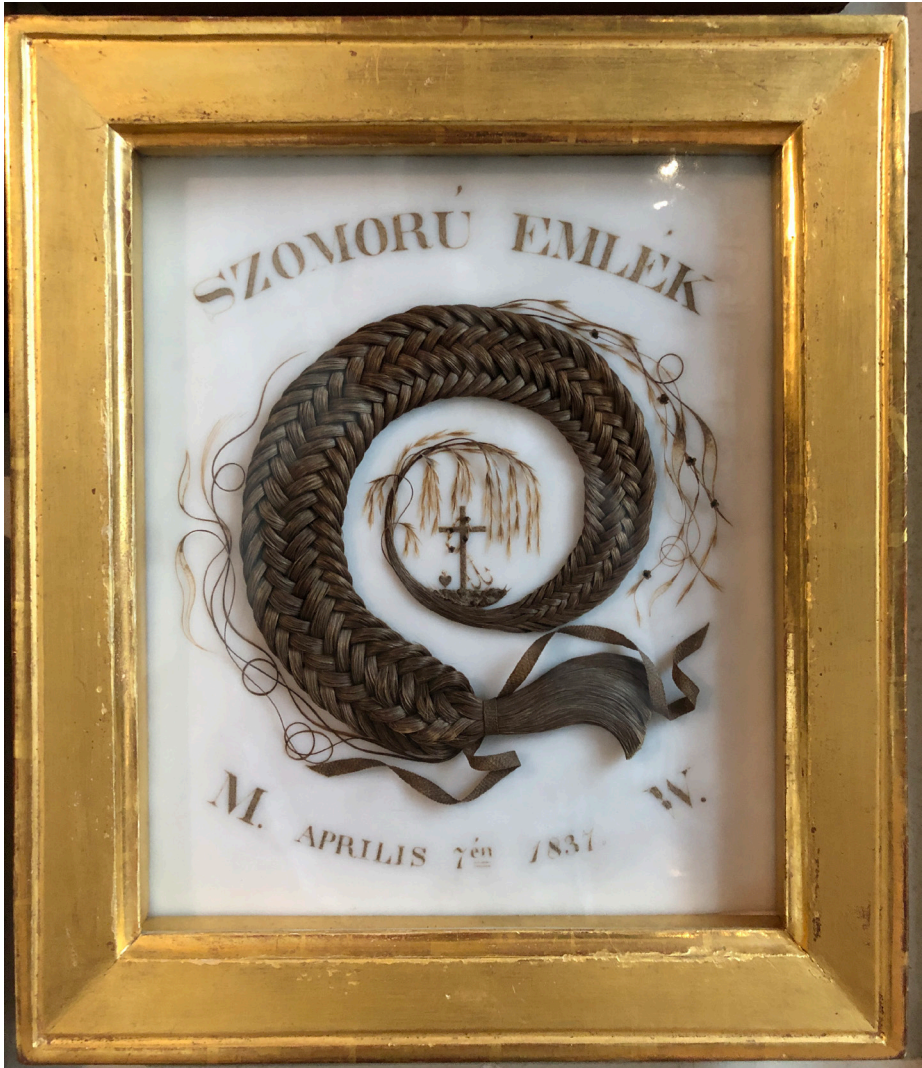
Obr. 11 Nástenný votívny obraz so ženským vrkočom v dekoratívnej úprave. Múzeum mariazellskej pokladnice. Foto: 06/2022.