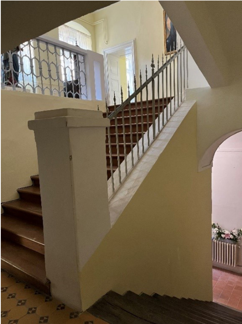
Obr. 18 Schodisko spájajúce sakristiu na prízemí s oratóriom na druhom nadzemnom podlaží kláštora tešíteľov. Foto: 09/2022.